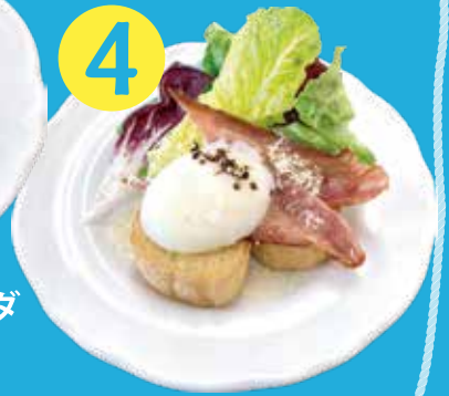
ベーコン・温泉卵 サラダ シーザードレッシング