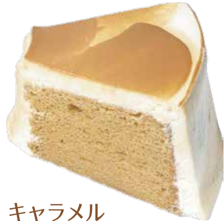
キャラメル シフォンケーキ