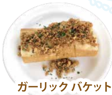
ガーリックバケット ¥320 (税込 ¥352)