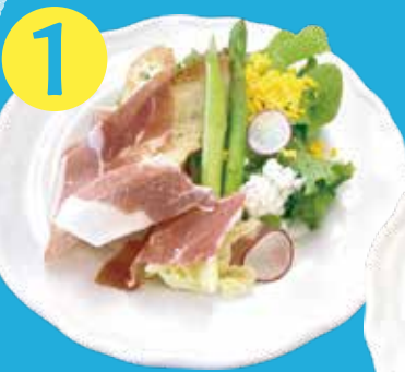
生ハム・アスパラ サラダ バルサミコ酢ドレッシング