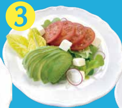
トマト・アボカド サラダ バリバリドレッシング