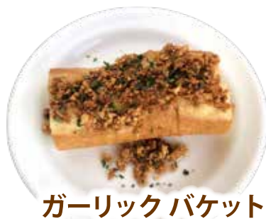
ガーリックバケット