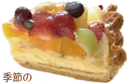
季節の フルーツタルト