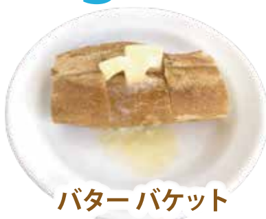
バターバケット ¥290 (税込 ¥319)