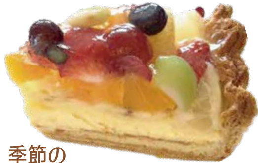
季節の フルーツタルト