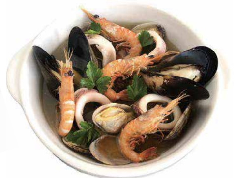
漁師風アヒージョ