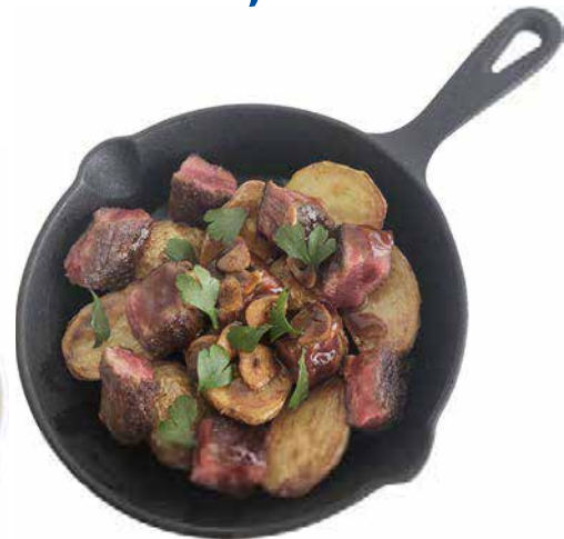
サイコロステーキ