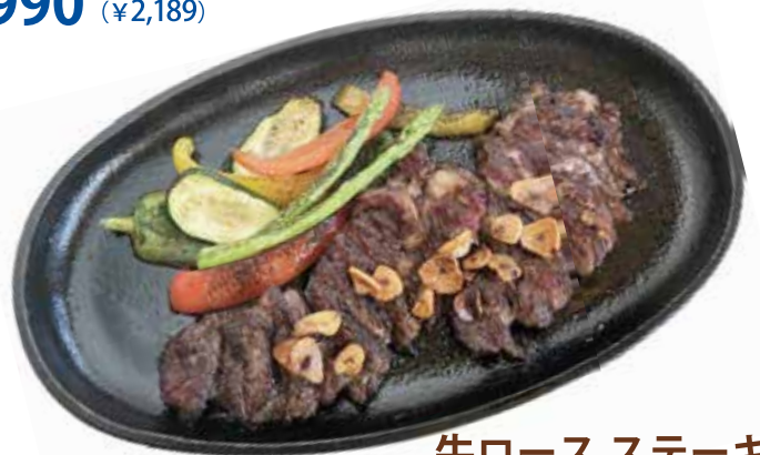
牛ロースステーキ ガーリック醤油ソース