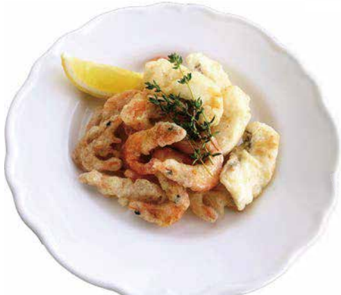
魚・地エビフリット