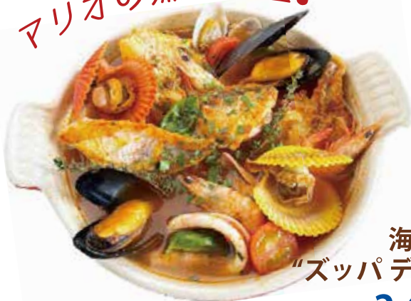
海の幸 "ズッパディペッシェ"