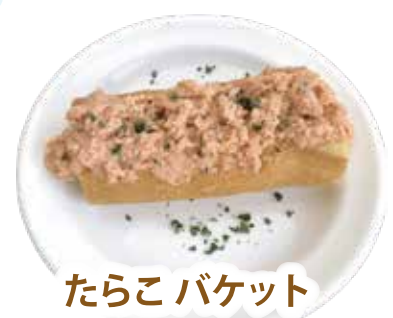
たらこバケット ¥390 (税込 ¥429)