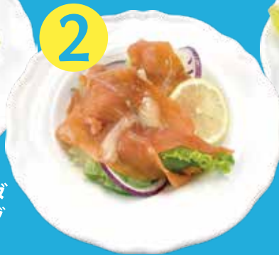
サーモン・オニオン サラダ フレンチマスタードドレッシング