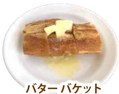
バタールバケット