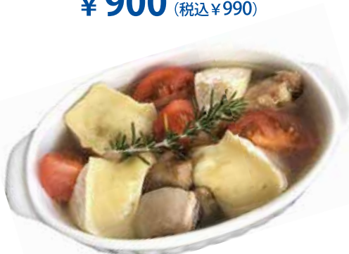
チキン・カマンベール アヒージョ