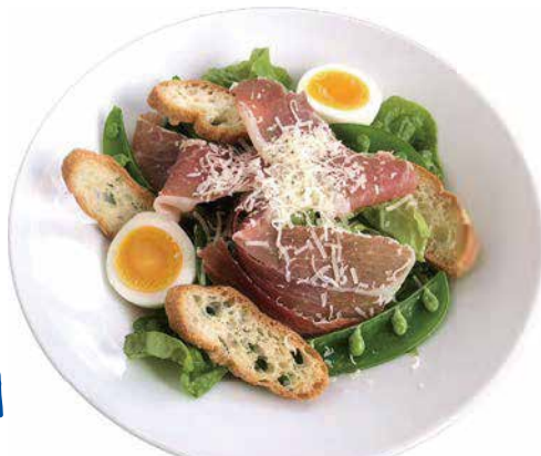
生ハム サラダ イタリアンドレッシング