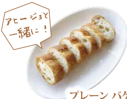
プレーン バゲット ¥300 (¥324)