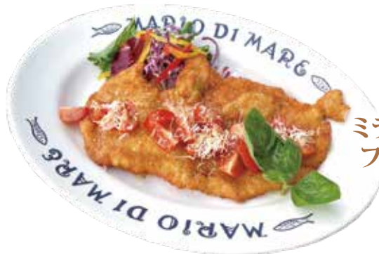
ミラノ風 ポークカツレツ フレッシュトマトソース ¥1,990 (¥2,149)