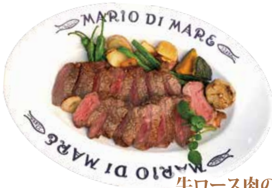
牛ロース肉のステーキ オニオンソース 250g ¥2,890 (¥3,121)