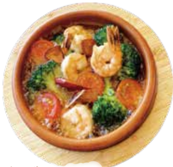
エビ・ブロッコリー・ミニトマト アヒージョ ¥1,090 (¥1,177)