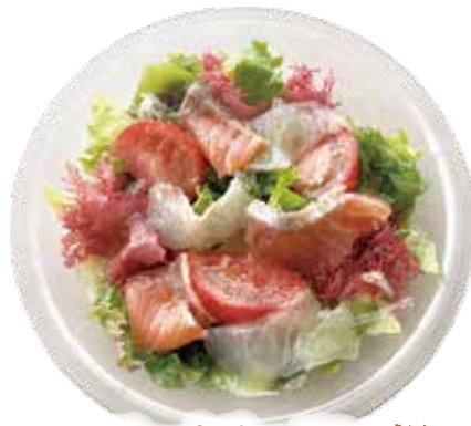
スモークサーモン・鯛 カルパッチョ サラダ ¥1,290 (¥1,393)