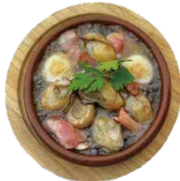
地御前 牡蠣・マッシュルーム アヒージョ ¥1,290 (¥1,393)