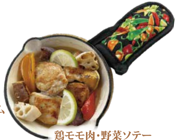
鶏モモ肉・野菜ソテー 焦がしバターレモンソース ¥1,590 (¥1,717)