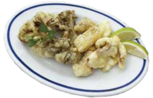
本鯛・女鹿平 舞茸のフリット クミン風味 ¥1,290 (¥1,393)