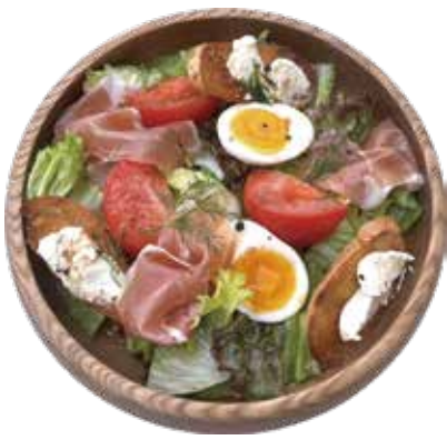
生ハム・チーズバケット イタリアン サラダ ¥1,290 (¥1,393)