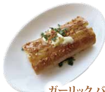
ガーリック バゲット ¥380