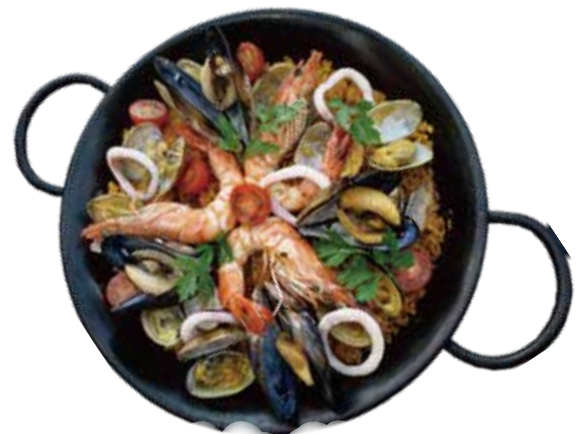
アサリ・ムール貝・有頭エビ マリオの海賊 パエリア ¥2,890 (¥3,121)