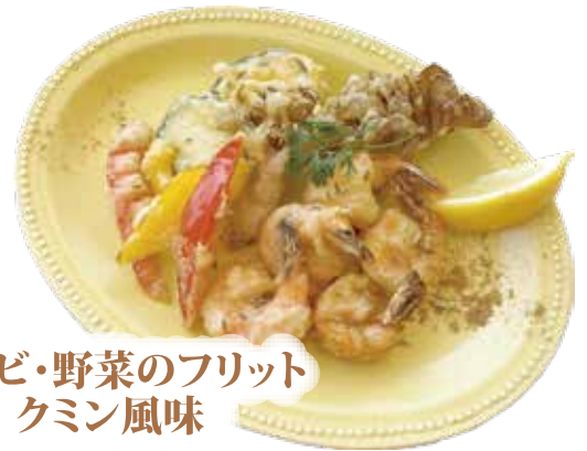
地エビ・野菜のフリット クミン風味