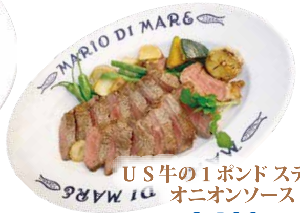
US牛の1ポンドステーキ オニオンソース