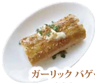
ガーリック バゲット