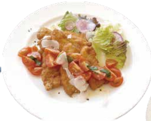
ポークカツレツ フレッシュトマトソース