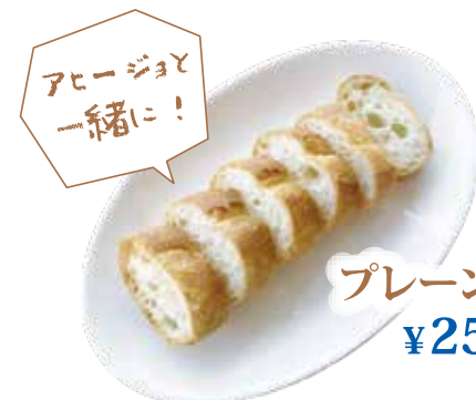
プレーンバゲット