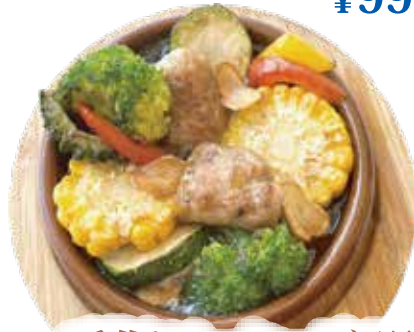
手作りソーセージ・野菜 アヒージョ