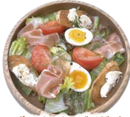
生ハム・チーズバゲット イタリアン サラダ