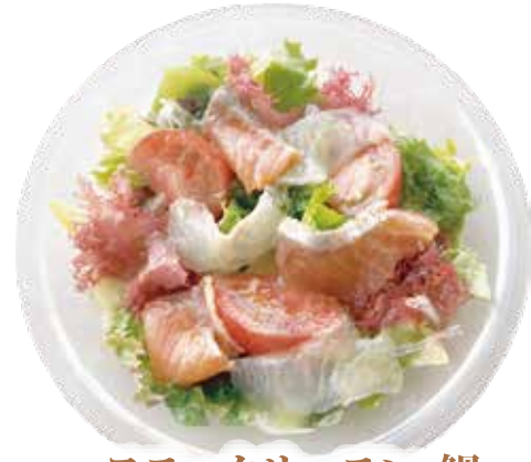
スモークサーモン・鯛 カルパッチョ サラダ