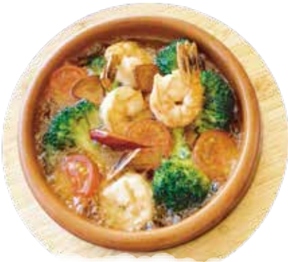
エビ・ブロッコリー アヒージョ