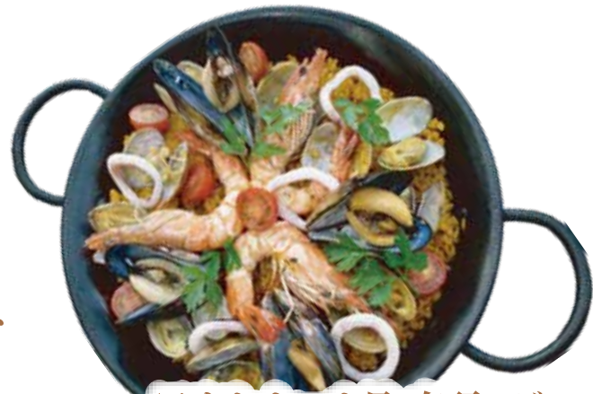
アサリ・ムール貝・有頭エビ マリオの海賊 パエリア