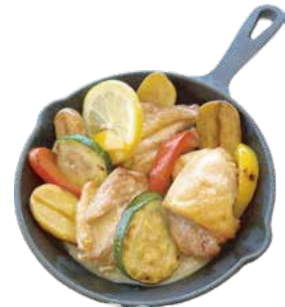
長州鶏 モモ肉のソテー レモンバターソース