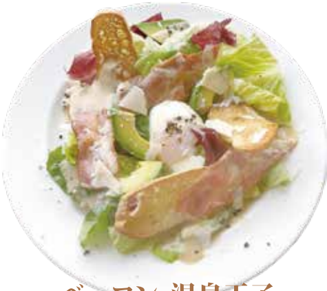
ベーコン・温泉玉子 シーザーサラダ