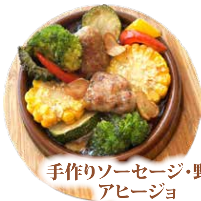
手作りソーセージ・野菜 アヒージョ