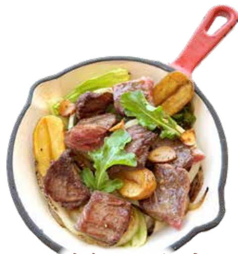
サイコロ ステーキ ガーリックソース