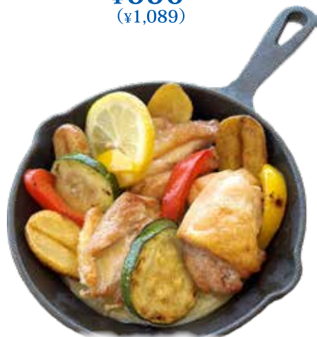
長州鶏 モモ肉のソテー レモンバターソース