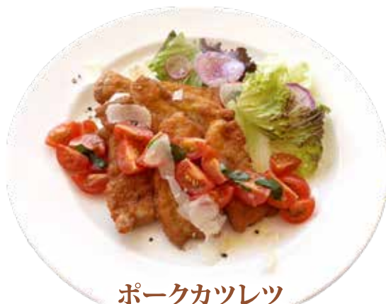
ポークカツレッツ フレッシュトマトソース