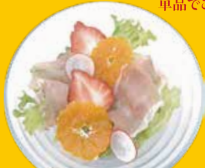
1. 生ハム・フルーツ イタリアン サラダ