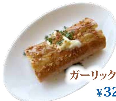
ガーリック バゲット