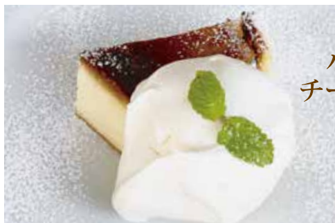
バスク風 チーズケーキ