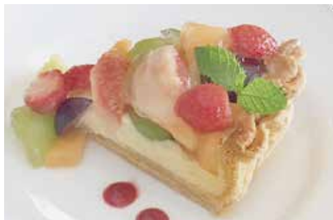
マリオの フルーツタルト