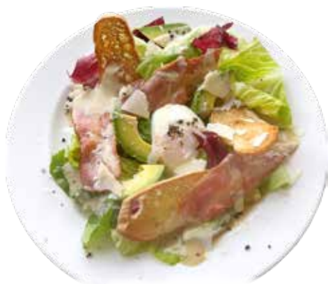
ベーコン・温泉玉子 シーザーサラダ