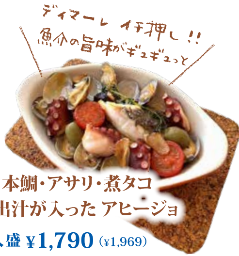
本鯛・アサリ・煮タコ お出汁が入ったアヒージョ