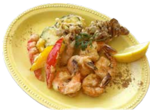
地エビ・野菜のフリット クミン風味