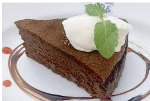
イタリアン チョコケーキ