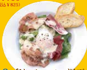
3. 炙りベーコン・温泉玉 シーザーサラダ