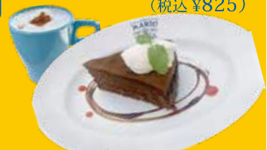
3. イタリアン チョコケーキ