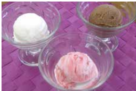
井口台「Latte Latte」の ゼラート各種

源氏パイ キャラメルソース ミルクゼラート リンゴのコンポート 紅茶ゼリー 生クリーム ガラノーラ 紅茶のパンナコッタ