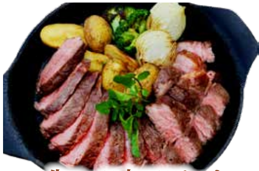
牛ロース肉のステーキ オニオンソース