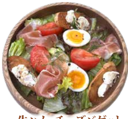
生ハム・チーズバゲット イタリアン サラダ