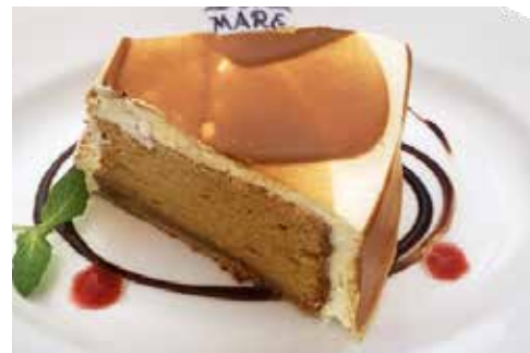
キャラメル シフォン