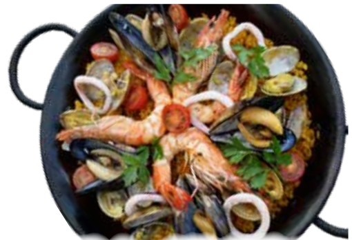
アサリ・ムール貝・有頭エビ マリオの海賊パエリア