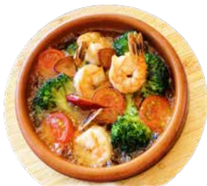
エビ・ブロッコリー アヒージョ