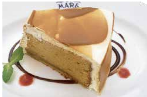
キャラメル シフォン