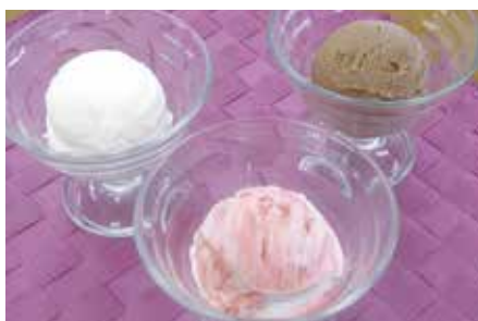
井口台「Latte Latte」の ジェラート各種