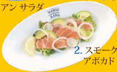
2. スモークサーモン アボカド サラダ