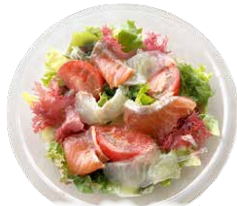
スモークサーモン・鯛 カルパッチョ サラダ