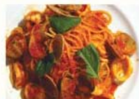
アサリ、エビ、イカ、バジリコの トマトソース スパゲッティ ¥1,050