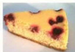
ラズベリーチーズケーキ