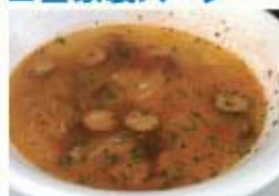
ミネストローネスープ