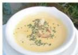
北海道コーンのクリーミーな コーンポタージュスープ