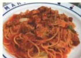
豚煮込みとキャベツの トマトソース スパゲッティ ¥930