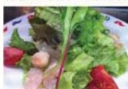
ぶりぶり海老と小柱のサラダ 野菜ばりばりドレッシング