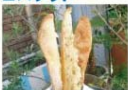
バケットタワー 3種 (ガーリック・明太子・ハチミツ)