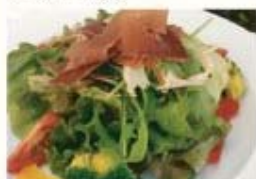
サラミと彩り野菜の イタリアンコンビネーションサラダ