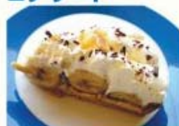
バナナチョコカスタードタルト