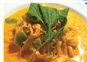
エビ、空豆、ルッコラの トマトクリームソース タリオリーニ スパゲッティ ¥1,050