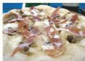
生ハム、きのこ、 モッツアレラチーズの白いピッツア ¥1,100