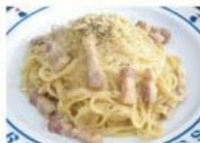
厚切りベーコンとオニオン、卵 生クリームのカルボナーラ スパゲッティ ¥900