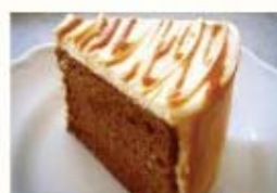
キャラメルシフォンケーキ