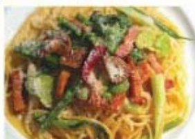
ベーコンと夏野菜、パルメザン チーズのガーリックスパゲッティ ¥850