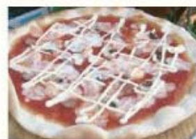
海老、ソーセージ、オニオンの トマトソースピッツア“カプリチョーザ” ¥1,100