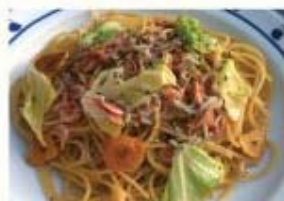
桜海老としらす、キャベツの ガーリックスパゲッティ アンチョビ風味 ¥880