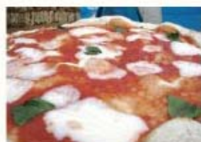
モッツアレラチーズとバジリコの トマトソースピッツア ¥980