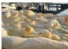
はちみつとゴルゴンゾーラチーズ のクリームソースピッツア ¥950