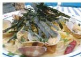
あさり、海老、イカ、たらこ、 青じその海賊スパゲッティ ¥950