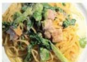
チキンと緑野菜のクリームソース スパゲッティ ¥900