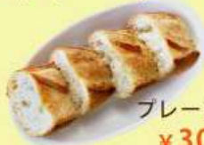
プレーン バゲット ¥ 300 (税込 ¥ 330)