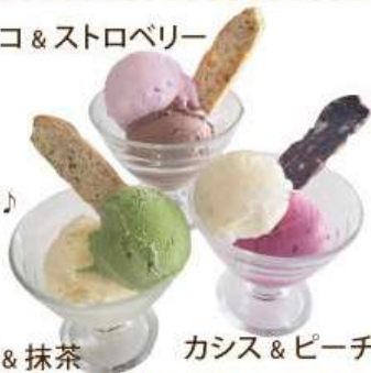
バニラ & 抹茶