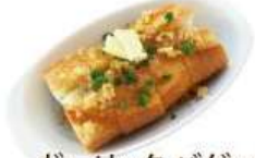
ガーリックバゲット ¥460 (税込 ¥506)