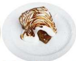
3. キャラメル シフォンケーキ