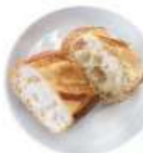
プレーン ハーフ バゲット ¥150 (税込 ¥165)