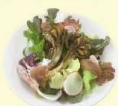
4. 生ハム・舞茸 マリネサラダ