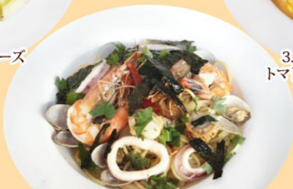
2. 有頭エビ・アサリ・イカ・ホタテ 海賊スペシャル スパゲッティ