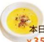
本日のスープ ¥350 (税込 ¥385)