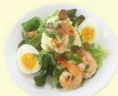
1. ガーリックシュリンプ ポテトサラダ