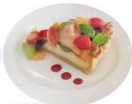
1. バスク風 チーズケーキ