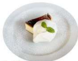
1. バスク風 チーズケーキ