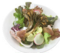
4. 生ハム・舞茸 マリネサラダ