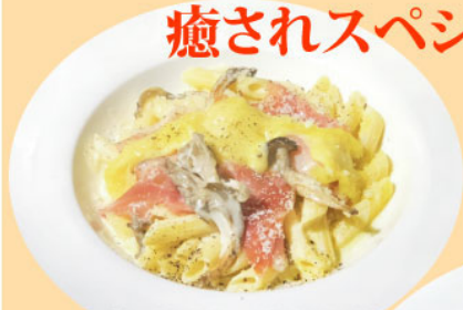
1. 生ハム・キノコ・4種のチーズ クリームペンネ