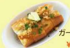
ガーリック バゲット ¥ 460 (税込 ¥ 506)