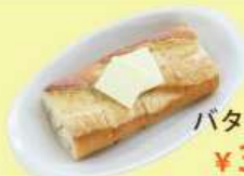
バター バゲット ¥ 350 (税込 ¥ 385)