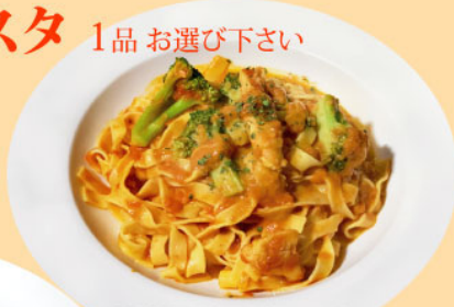
3. スワイガニ・ブロッコリー トマトクリームソース タリアテッレ