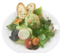
3. サーモン・アボカド タルタルサラダ