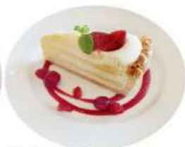
2. カマンベール チーズタルト