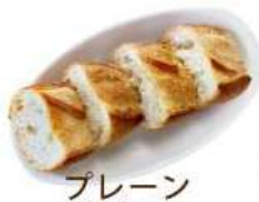
プレーン バゲット ¥300 (税込 ¥330)