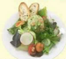
3. サーモン・アボカド タルタルサラダ