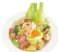
2. ベーコン・温玉 シーザーサラダ