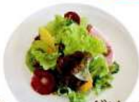
グリーンサラダ ¥290 (税込 ¥319)