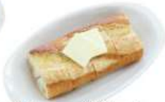
バター バゲット ¥350 (税込 ¥385)