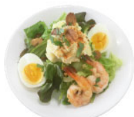
1. ガーリックシュリンプ ポテトサラダ