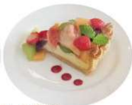
4. 季節の フルーツタルト