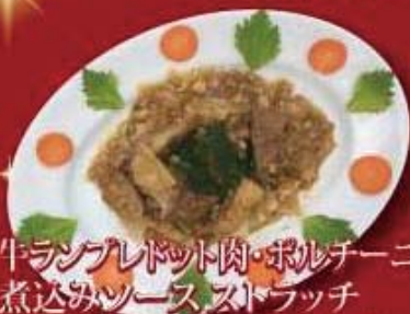
牛ラングレット肉・ポルチーニ茸 煮込みソース・ストラッチ ¥1,480 税抜