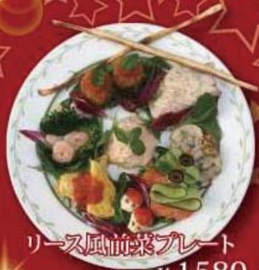
リース風前菜プレート ¥1,580 税抜