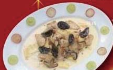
リードザオー・肉厚椎茸 クリームソースパッパルデッレ ¥1,480 税抜