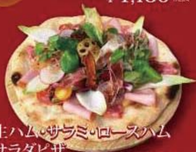
生ハム・サラミ・ロースハム サラダピザ ¥1,480 税抜