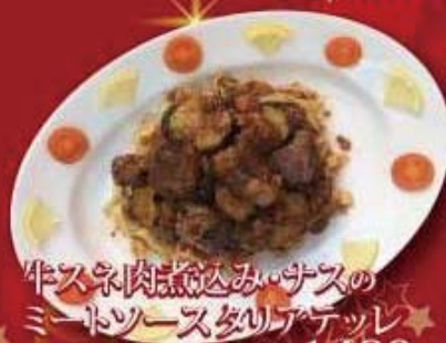
牛スネ肉煮込み・サスの ミートソースタリアテッレ ¥1,480 税抜