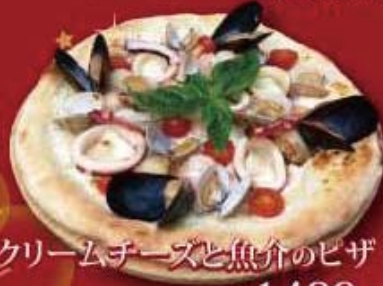
クリームチーズと魚介のピザ ¥1,480 税抜