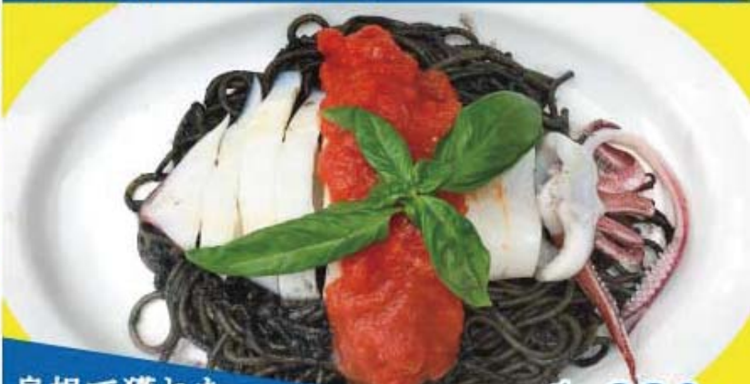
島根で獲れた 活水イカ イカ墨ソース