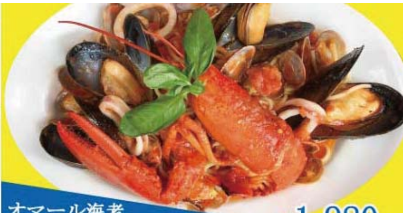
オマール海老 新鮮魚介のスパゲッティ